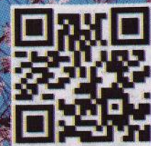
▲掃描QR碼可觀看活動視頻。

【明報專訊】溫哥華櫻花節（Vancouver Cherry Blossom Festival）昨日在風和日麗下登場，鼓樂表演別具文化特色，吸引逾百市民駐足觀賞。