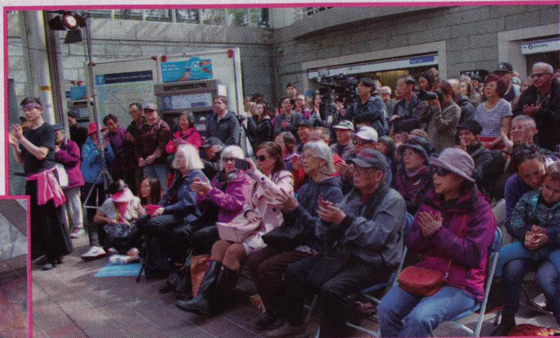
▲大批市民在布勒架空列車站大堂駐足觀賞表演。