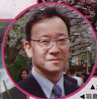
▲溫市櫻花絢爛綻放。 ▲羽鳥隆總領事希望出席櫻花節的市民可以認識日本文化。